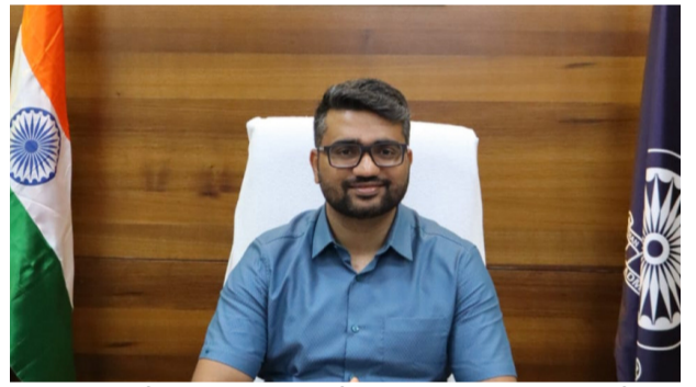
ఇబ్బందులు లేకుండా పెండింగ్లో ఉన్న దరఖాస్తులను వెంటనే పరిష్కరించాలని అధికారులకు ఆదేశాలు జారీ చేశారు. ప్లాట్ల యజమానులు ఈ చివరి అవకాశాన్ని సద్వినియోగం చేసుకొని తమ స్థలాలను చట్టబద్ధంగా క్రమబద్ధీకరించుకోవాలని కమిషనర్ కోరారు.

అనధికార లేఅవుట్లలో ప్లాట్లు కలిగిన యజమానులు లేఅవుట్ క్రమబద్ధీకరణ పథకం (ఎల్ఆర్ఎస్)ను వినియోగించుకోవాలని గుంటూరు నగర కమిషనర్ కె. మయూర్ అశోక్ సూచించారు. ప్రభుత్వం గతంలో ఇచ్చిన మూడు నెలల గడువు ఈ నెల 23వ తేదీతో ముగియనున్న నేపథ్యంలో అప్రమత్తంగా ఉండాలని తెలిపారు. ఎల్ఆర్ఎస్ కింద ప్లాట్లను క్రమబద్ధీకరించుకోకపోతే భవన నిర్మాణ అనుమతులు మంజూరు కావని, రోడ్డు, డ్రైనేజీ వంటి మౌలిక సదుపాయాలు కూడా అందుబాటులో ఉండవని హెచ్చరించారు. అదేవిధంగా భవిష్యత్తులో ప్లాట్ల కొనుగోలు, అమ్మకాల సమయంలో రిజిస్ట్రేషన్ ప్రక్రియలో ఇబ్బందులు తలెత్తే అవకాశం ఉందన్నారు. గడువు ముగిసిన తర్వాత అనధికార లేఅవుట్లపై కఠిన చర్యలు తీసుకుంటామని స్పష్టం చేశారు. ప్రజలకు