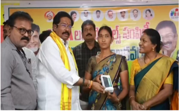
నిర్వహించవచ్చని చెప్పారు. అందుకున్న స్టార్ట్ ఫోన్లను సమర్థంగా వినియోగించుకుని ప్రజలకు మెరుగైన సేవలు అందించాలని వీఓఏలకు సూచించారు. కార్యక్రమంలో సంబంధిత అధికారులు, వీఓఏలు మరియు ఇతరులు పాల్గొన్నారు.

పల్నాడు జిల్లా వినుకొండలో గ్రామ సంఘాల సహాయకులు (వీఓఏలు)కు స్టార్ట్ ఫోన్ల పంపిణీ కార్యక్రమం జరిగింది. శనివారం ఎమ్మెల్యే జీవి ఆంజనేయులు తన కార్యాలయంలో నిర్వహించిన కార్యక్రమంలో వీఓఏలకు స్వయంగా స్టార్ట్ ఫోన్లను అందజేశారు. ఈ సందర్భంగా ఎమ్మెల్యే జీవి ఆంజనేయులు మాట్లాడుతూ గ్రామీణ ప్రాంతాల్లో మహిళా సాధికారతకు వీఓఏలు కీలకంగా పనిచేస్తున్నారని పేర్కొన్నారు. ప్రభుత్వ పథకాలను ప్రజలకు చేరవేయడంలో వారధులుగా నిలుస్తున్నారని తెలిపారు. గ్రామ స్థాయిలో మహిళా సంఘాలతో కలిసి వీఓఏలు చేస్తున్న సేవలు అభినందనీయమని అన్నారు. డిజిటల్ సేవలను మరింత వేగవంతం చేయాలనే ఉద్దేశంతో ప్రభుత్వం ఈ స్టార్ట్ ఫోన్లను అందిస్తోందని ఎమ్మెల్యే తెలిపారు. ఈ ఫోన్ల ద్వారా ప్రభుత్వ పథకాల అమలు, డేటా సేకరణ, నివేదికల సమర్పణ వంటి పనులను సులభంగా