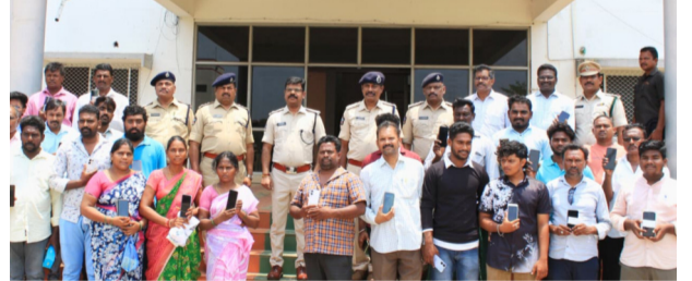
సహాయంతో టెలికాం సంస్థలతో సమన్వయం చేసి ఇతర జిల్లాలు, రాష్ట్రాల్లో ఉన్న ఫోన్లను కూడా ట్రేస్ చేసి రికవరీ చేస్తున్నామని తెలిపారు. ఈ చర్యల వల్ల మొబైల్ రికవరీ శాతం గతంలో 30 శాతం ఉండగా ప్రస్తుతం 65 శాతానికి పెరిగిందని వెల్లడించారు. అలాగే సరైన ఆధారాలు లేకుండా సెకండ్ హ్యాండ్ మొబైల్ ఫోన్లు కొనరాదని, లాక్ ఓపెన్ చేయరాదని షాపుల యజమానులకు హెచ్చరించారు. అనుమానాస్పదంగా ఫోన్లు అమ్మే వారిపై వెంటనే పోలీసులకు సమాచారం ఇవ్వాలని సూచించారు. కార్యక్రమంలో డీఎస్పీలు, పోలీసులు, సిబ్బంది మరియు మొబైల్ ఫోన్లు అందుకున్న బాధితులు పాల్గొన్నారు.