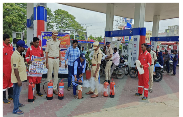
సిబ్బంది మరియు అగ్నిమాపక సిబ్బంది పాల్గొన్నారు.

బాపట్ల జిల్లా అగ్నిమాపక శాఖ ఆధ్వర్యంలో నిర్వహిస్తున్న అగ్నిమాపక వారోత్సవాల్లో భాగంగా శనివారం ఐదవ రోజు కార్యక్రమాలు చేపట్టారు. ఈ సందర్భంగా బాపట్ల అగ్నిమాపక కేంద్రం పరిధిలోని పెట్రోల్ బంకులు, ఎల్పీజీ గ్యాస్ సిలిండర్ గోదాములు మరియు పరిశ్రమల్లో అగ్ని ప్రమాదాల నివారణపై ప్రత్యేక అవగాహన కార్యక్రమాలు నిర్వహించారు. జిల్లా అగ్నిమాపక అధికారి కె. వినయ్ ప్రజలు, యాజమాన్యం, సిబ్బందికి అగ్ని ప్రమాదాలు జరగకుండా తీసుకోవాల్సిన జాగ్రత్తలు, అప్రమత్తత గురించి వివరించారు. అగ్ని ప్రమాదాల నివారణకు సంబంధించి కరపత్రాలు, గోడపత్రికలను పంపిణీ చేసి భద్రతా చర్యలను తెలియజేశారు. ఈ కార్యక్రమంలో స్థానిక అగ్నిమాపక కేంద్ర అధికారి జి. రామ సిద్ధార్థ, పెట్రోల్ బంకులు, గ్యాస్ గోదాముల యాజమాన్యం,